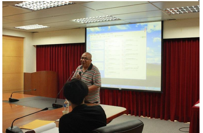
說明：跨域創意設計競賽報告情形