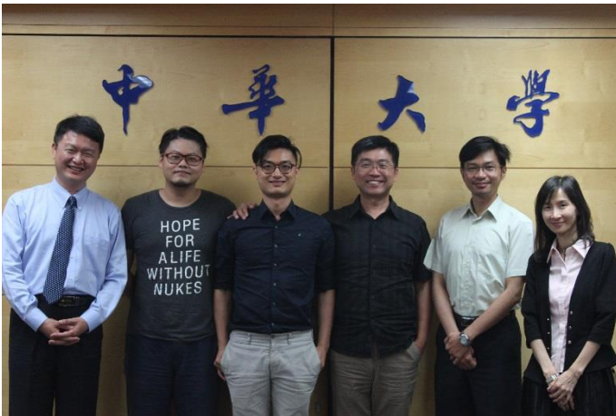
說明：跨域創意設計競賽評審團隊