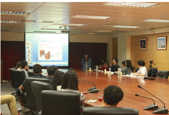
說明：跨域創意設計競賽報告情形