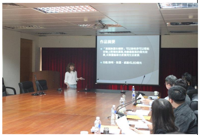
說明：跨域創意設計競賽報告情形