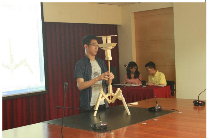
說明：跨域創意設計競賽報告情形