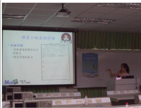
說明：各系教師教學經驗分享情形