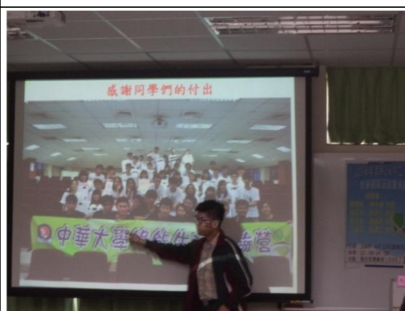
說明：各系教師教學經驗分享情形