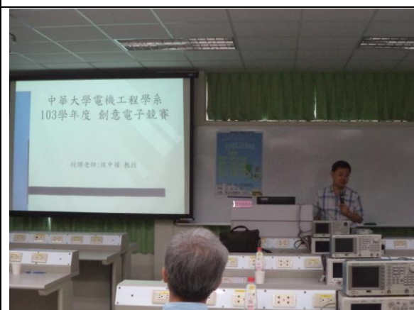
說明：各系教師教學經驗分享情形