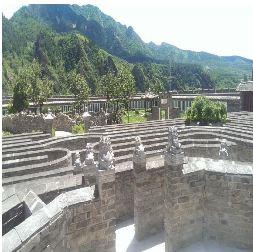
說明：長城迷宮中心