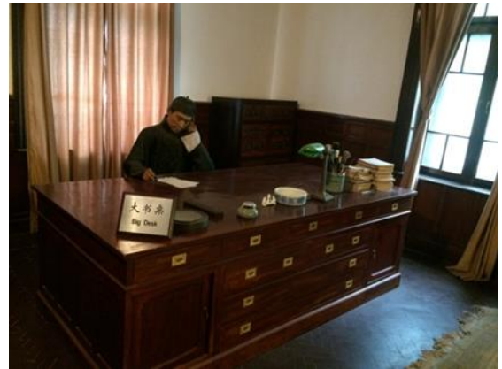
說明：梁啟超飲冰室