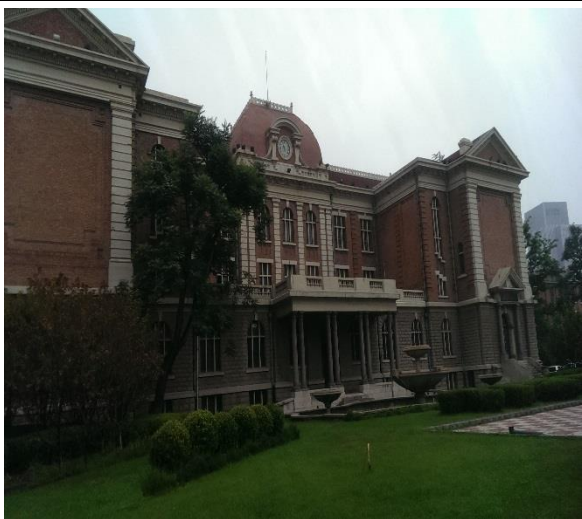
說明：天津外國語大學校徽參考建築物