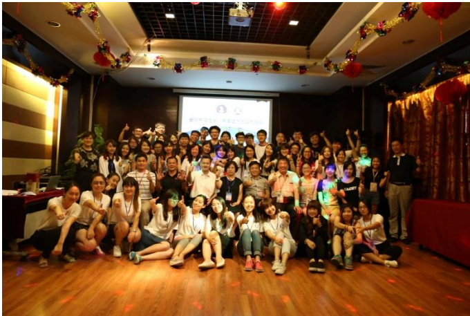
說明：歡送晚會，雖然不捨但天下無不散的宴席