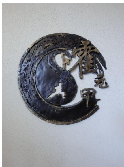
說明：霍元甲紀念館